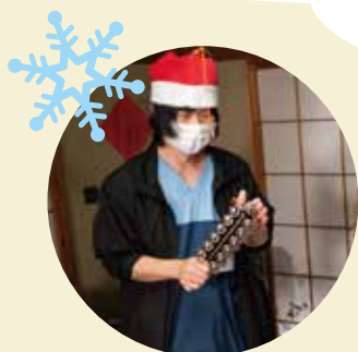
本格的な鈴で クリスマスムードは完璧!

クリスマスはワクワクするよね! 寒くなってくると気持ちも落ち込んだり しやすいけど、利用者さんに温かい ひとときをプレゼントする気持ちで 僕たちも音楽演奏をしたんだよ。