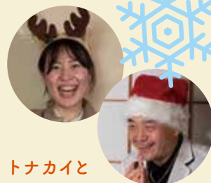
トナカイと サンタの姿で みんな笑顔に